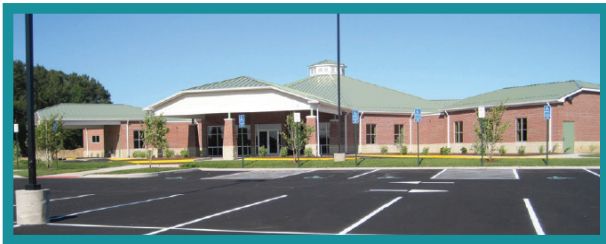
Rural Health's Atlantic Community Health Center

Eastern Shore Rural Health System, Inc. es un centro de salud comunitario calificado por el gobierno federal. Fundado en 1976 por un grupo visionario que se esfuerza por mejorar la atención médica en la costa Este de Virginia, Rural Health se ha convertido en el proveedor médico de elección para más de la mitad de la población de la región.